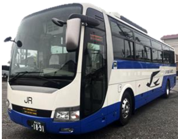
運行車両イメージ(広栄交通バス)

※アライアンス契約とは、企業同士が戦略的な提携関係を結ぶことで、お互いの強みとなる経営資源を共有し、事業拡大を目指す契約です。本契約により、広栄交通バスはジェイアールバス関東カラーの車両を使用して同路線の運行業務を行い、ジェイアールバス関東はノウハウや販売企画等の提供を行います。